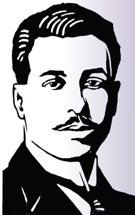
Ramón López Velarde A.P. Gallien, Prisma , 2 (2), junio de 1922

16 y 17 de mayo, 2019 9-14 hrs • Aula Magna-COLSAN