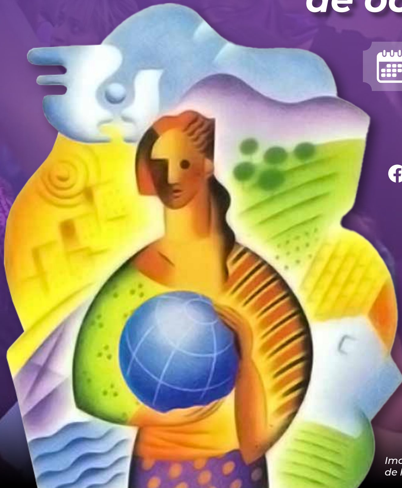
Imagen del cartel oficial de la IV Conferencia de la Mujer de 1995.

FEMU Federación Mexicana de Universitarias AC CAPÍTULO SAN LUIS POTOSÍ