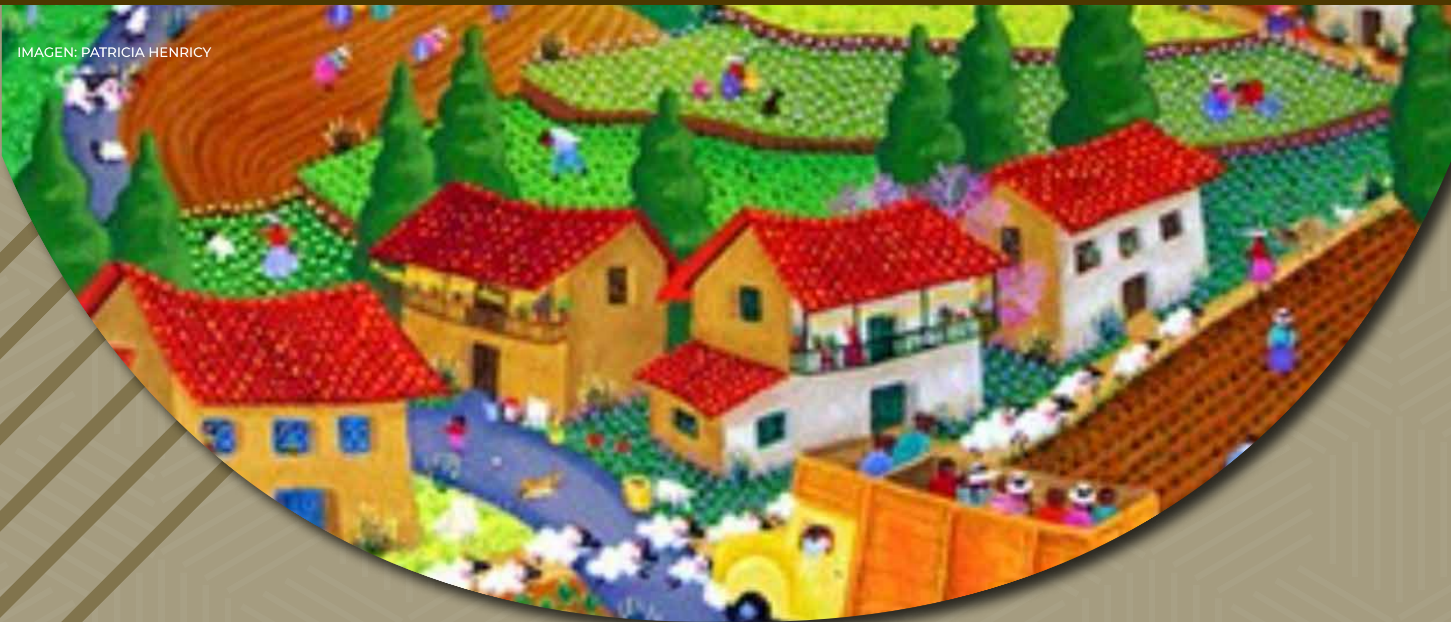
IMAGEN: PATRICIA HENRICY