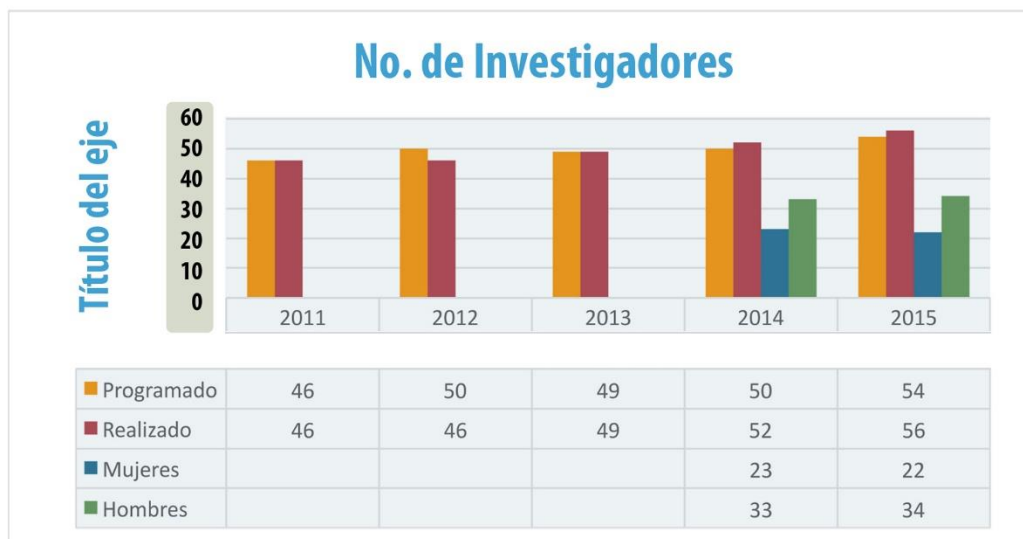
Gráfica No. 1. No. De Profesores investigadores