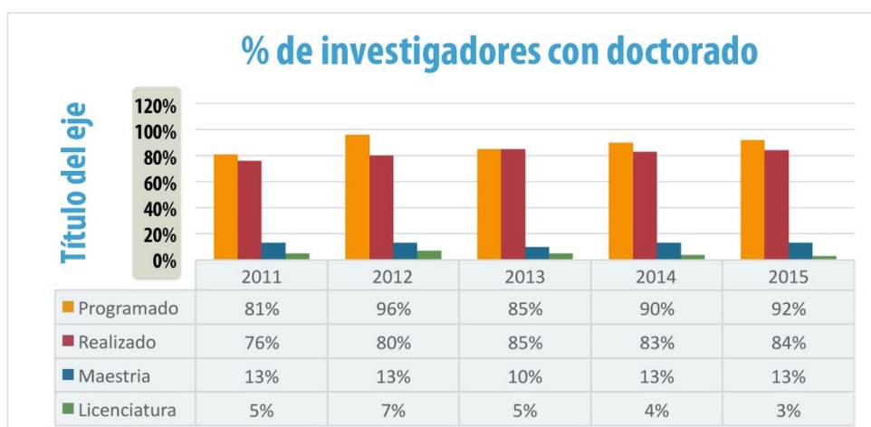
Gráfica No. 2. Profesores - Investigadores con Doctorado

En el año 2015, 47 investigadores cuentan con el grado de doctor (84%) de la planta con este grado. Siete con el grado de Maestría (13%) y dos con licenciatura (3%). De los siete profesores investigadores que cuentan con el grado de Maestría, cinco están cursando un programa de doctorado por lo que se espera que en los próximos tres años, adquieran el grado de doctor. Considerando los criterios establecidos, al finalizar 2015 el 96% de los profesores investigadores que integran la planta académica cuenta con estudios de posgrado.