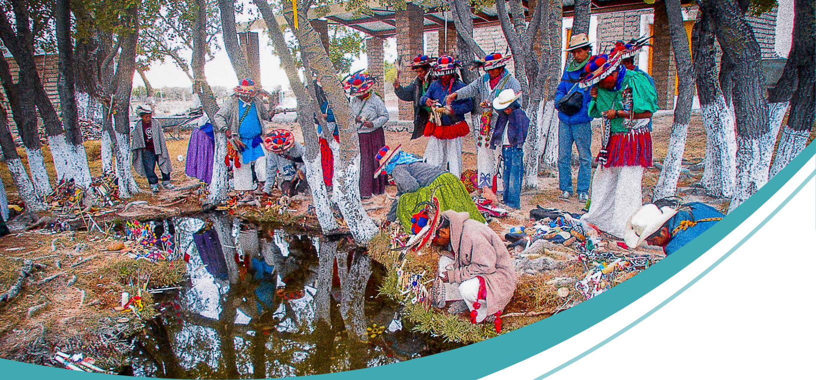
Sitio Sagrado Tatei Matineri, V. Ramos, SLP, Peregrinos de San Sebastián, 2011.